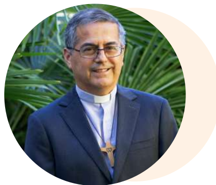
Sergio Pérez de Arce Arriagada Obispo de Chillán

E scribo estas palabras antes del 4 de septiembre, cuando prima la incertidumbre respecto de cuál será finalmente el resultado del plebiscito sobre la propuesta constitucional. Pero lo que está claro es que, cualquiera sea el resultado, el día 5 debe iniciarse un tiempo de diálogo y de acuerdo político, sea para iniciar un nuevo proceso constitucional (si gana el rechazo), sea para ir implementando la nueva Constitución, con las reformas que sean necesarias (si gana el apruebo). Y esto necesitará de todos, especialmente de los líderes sociales y políticos, un espíritu de escucha y de colaboración mutua, para buscar lo que más ayude al bien común.