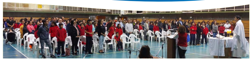
VER MÁS FOTOS EN GALERÍA FOTOGRÁFICA