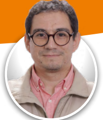
Gonzalo Morales S. Ciclo Superior

Los días martes 20 y jueves 22 de junio, se realizarán las últimas reuniones de padres, madres y apoderados del primer semestre de este año lectivo. En esta ocasión, cada Profesor/a Jefe compartirá las fortalezas y desafíos detectados en el ámbito académico, de convivencia escolar, socioemocional y pastoral para evaluar el progreso del curso y proyectar los aspectos a mejorar.