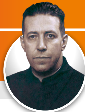
Alberto Hurtado S.J. Doctor en Educación

Extracto del capítulo diez del libro "Humanismo Social" escrito por el Padre Hurtado.