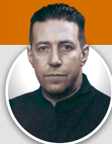
Alberto Hurtado S.J. Doctor en Educación