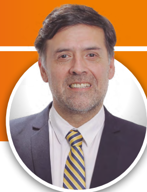
Rodrigo Navarrete Urzúa Rector

Este jueves 7 de septiembre, se dará inicio al proceso de Resignificación de nuestro Proyecto Educativo Institucional, como parte de la adecuación de nuestra propuesta educativa, considerando que el actual Proyecto tiene una data del año 2009.